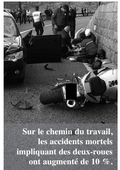
Sur le chemin du travail, les accidents mortels impliquant des deux-roues ont augmenté de 10 %.