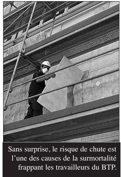
Sans surprise, le risque de chute est l’une des causes de la surmortalité frappant les travailleurs du BTP.

montrée dans le secteur de la construction pour des causes attribuables à des facteurs de risques professionnels connus.” Ils soulignent ainsi que les travailleurs de la construction